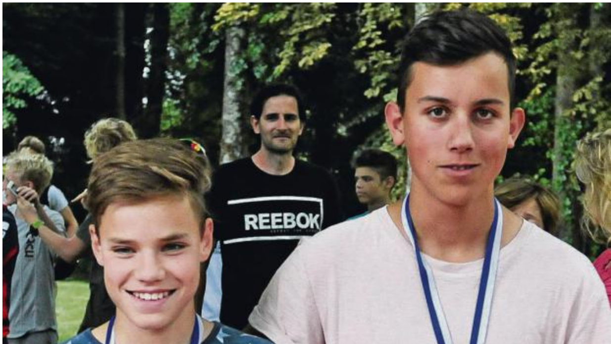
Schultria