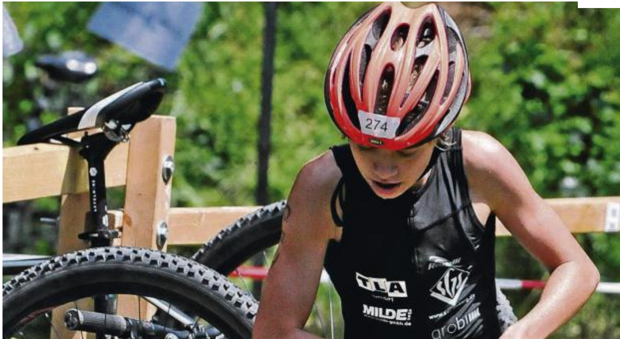
Schultria